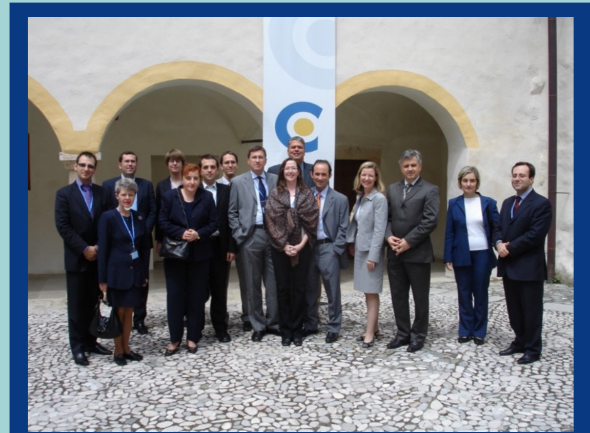
Atelier régional sur le droit et la pratique des traités, Ljubljana, Slovénie, 30 mai 2007