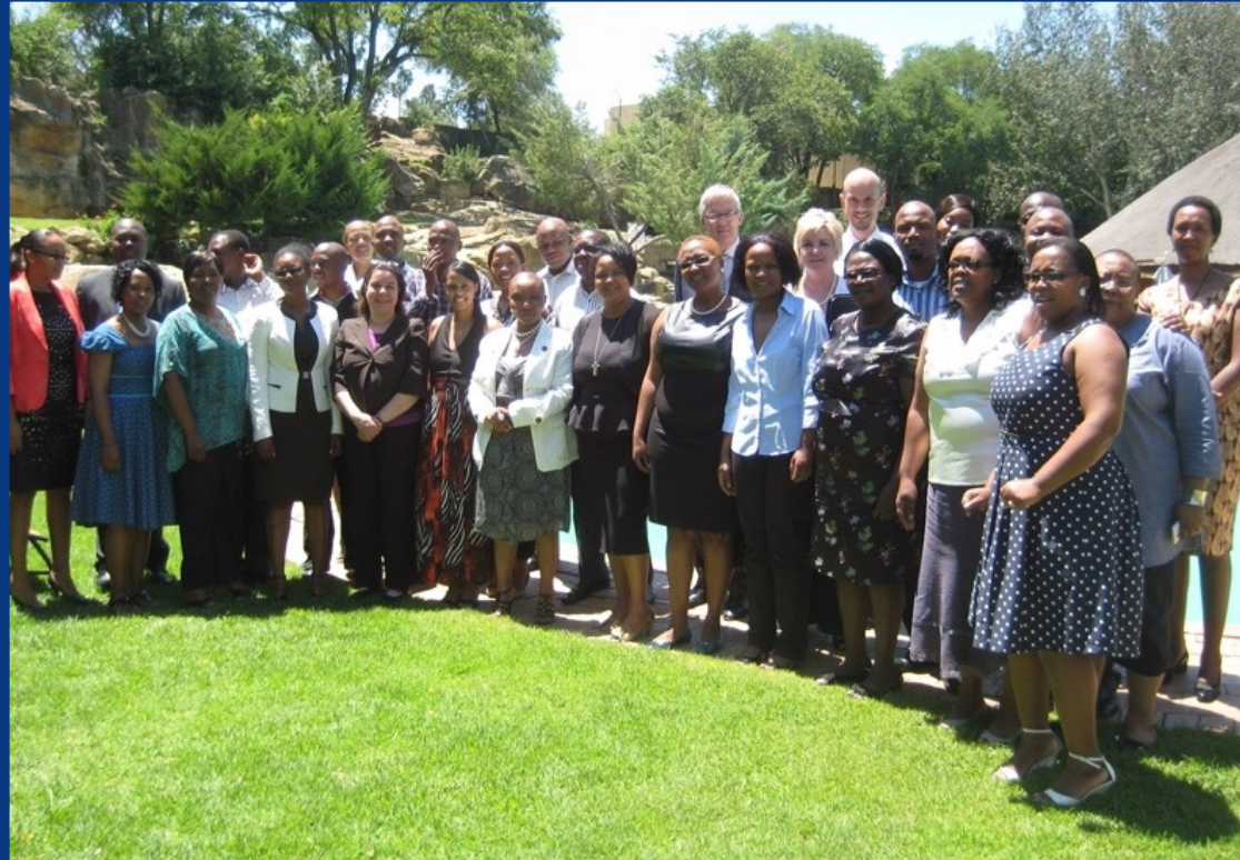
Atelier régional sur le droit et la pratique des traités, Maseru, Lesotho, 14 février 2014